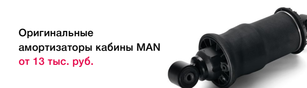
Оригинальные амортизаторы кабины MAN от 13 тыс. руб.