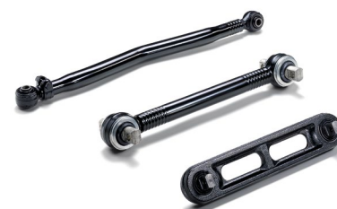
Оригинальные продольные рычаги MAN от 16 тыс. руб.