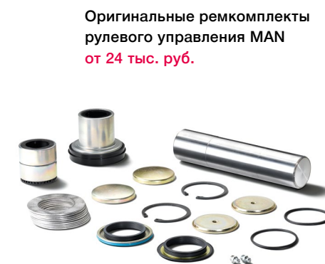
Оригинальные ремкомплекты рулевого управления MAN от 24 тыс. руб.