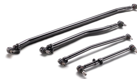
Оригинальные рулевые тяги MAN от 10 тыс. руб.