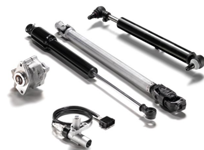
Оригинальные запчасти MAN для рулевого управления от 24 тыс. руб.