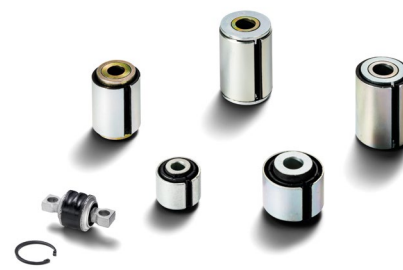
Оригинальные компоненты осей MAN от 3,5 тыс. руб.