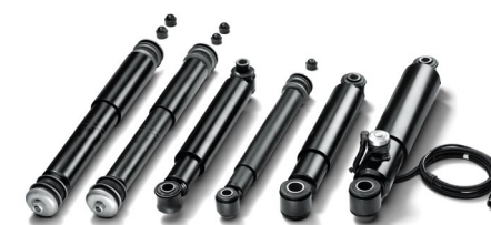
Оригинальные амортизаторы подвески MAN от 13 тыс. руб.