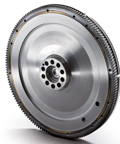
Оригинальные маховики MAN от 80 тыс. руб.