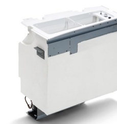
Оригинальный холодильный шкаф от 78 тыс. руб.