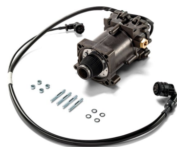
Оригинальные приводы сцепления от 23 тыс. руб.