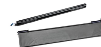
Оригинальные противосолнечные шторы MAN от 10 тыс. руб.