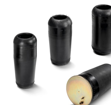
Оригинальные Пневмобаллоны MAN от 7 тыс. руб.