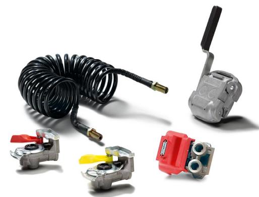
Оригинальные запчасти MAN для присоединения прицепа от 6 тыс. руб.